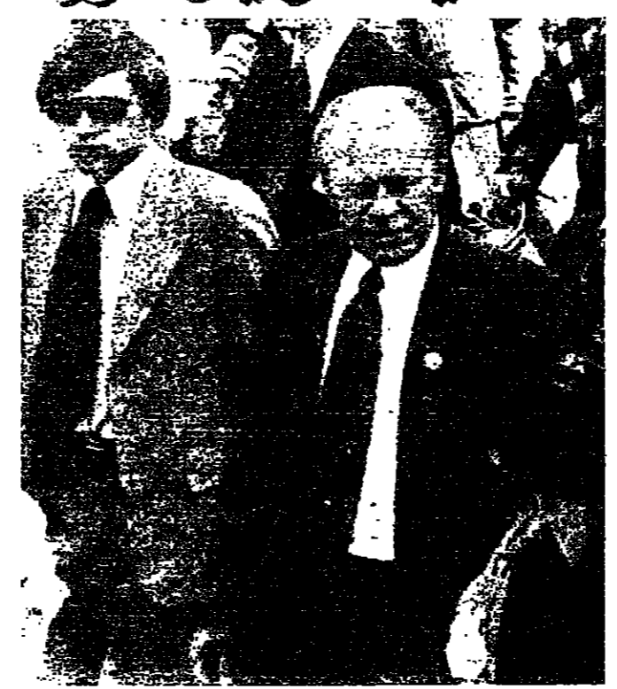
الرئيس الأميركي بعد آخر محاولة لاغتياله

وجهت إلى رجلين تهمة التآمر لقتل الرئيس جيرالد فورد في النهار نفسه الذي لجأ من محاولة اغتيال في سكرامنتو في ولاية كاليفورنيا. وقال اميركي ليني المسمى المسمو باسم اميركي في الاغتيال كاتسا يطغان الأحداث انجاز في مجاوره سكرامنتو خلال سير الرئيس فورد قرب نهاية الكابيتول القابضة للولاية، وذلك في ٥ ايلول الماضي على ان يستغل التوحي التي نشأ عن الانفجار كي يطلق عليه النار من بندقية صيد. وقال ليني ان الاثمة اخفت لان الرجلين المظلمين من العمل وهيسا غاري جيمس وعيسره ٢٢ سنة، وبريسونر مايو البالغ ٢٤ سنة اعتقلا